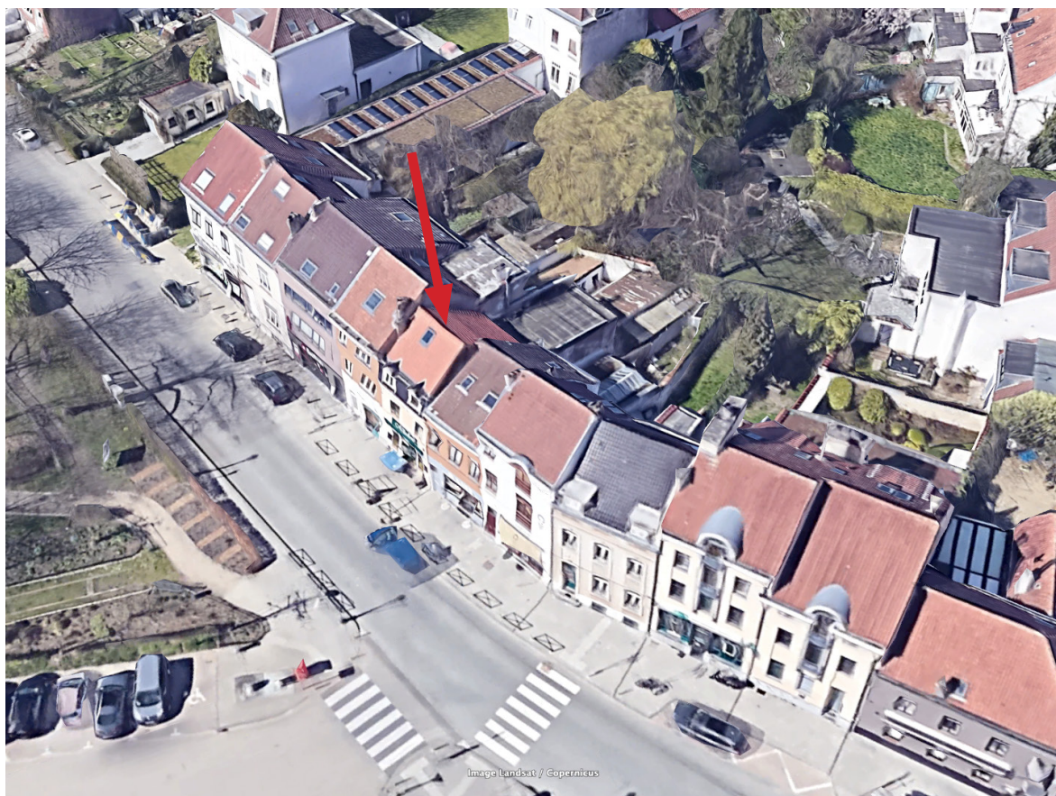
Vue aérienne façade avant