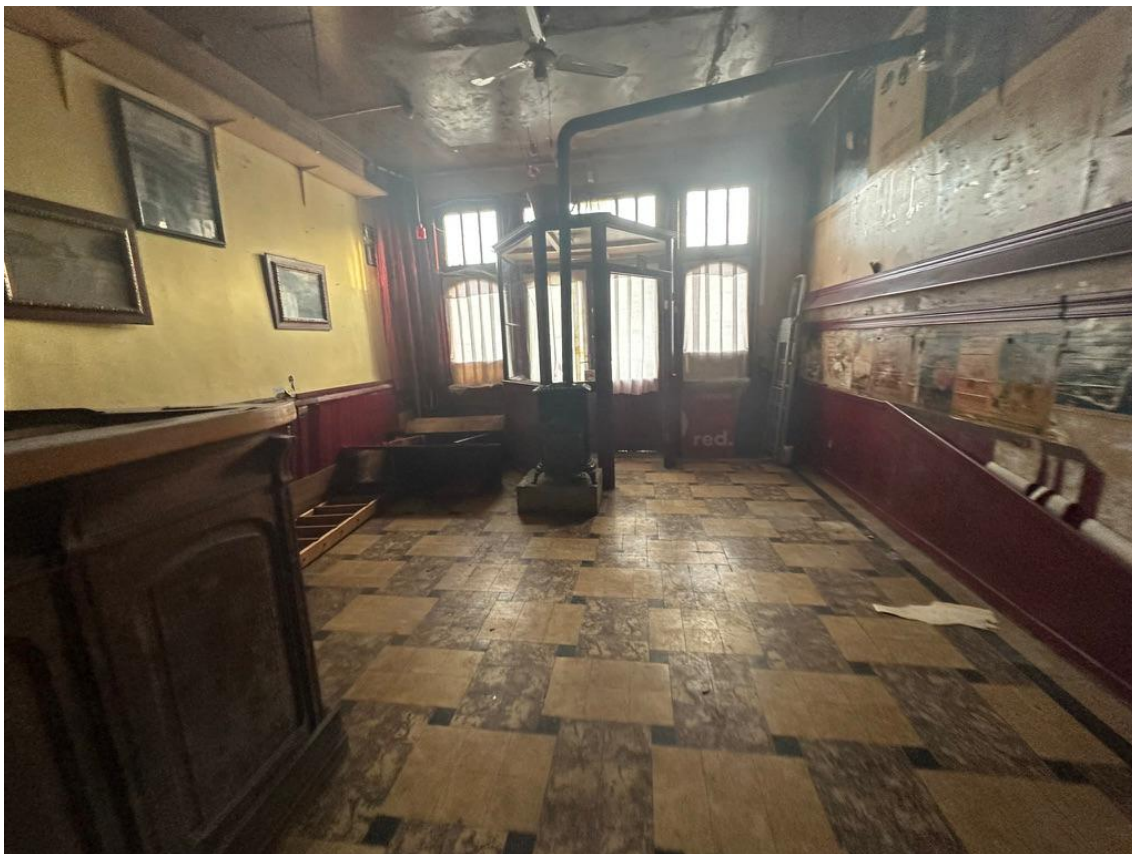
Vue 01 - Salle principale restaurant