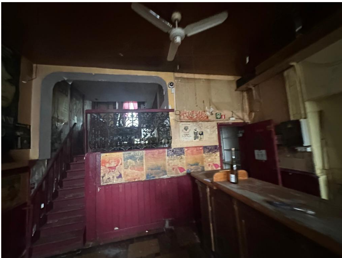
Vue 02 - Salle principale restaurant