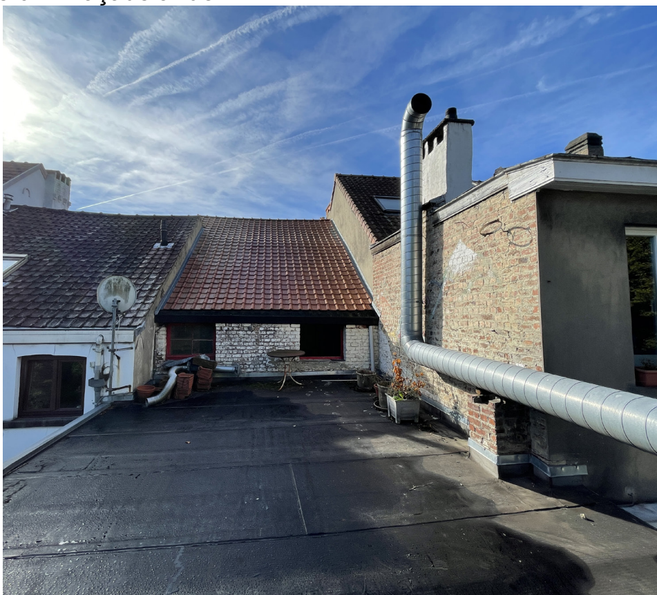
Vue 02 - Façade arrière