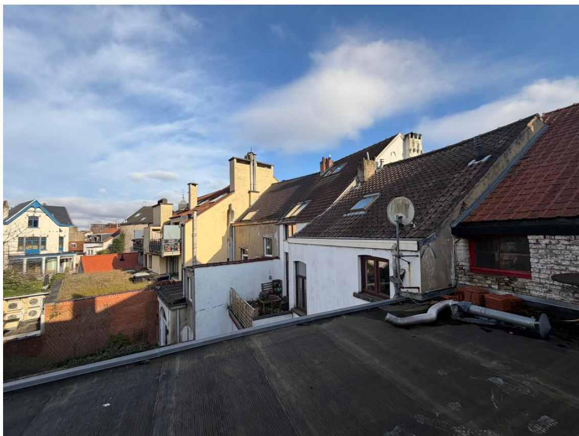
Vue 08 - Voisin droite n°4 façade arrière