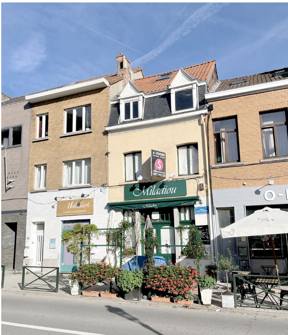
Vue 01 - Façade à rue