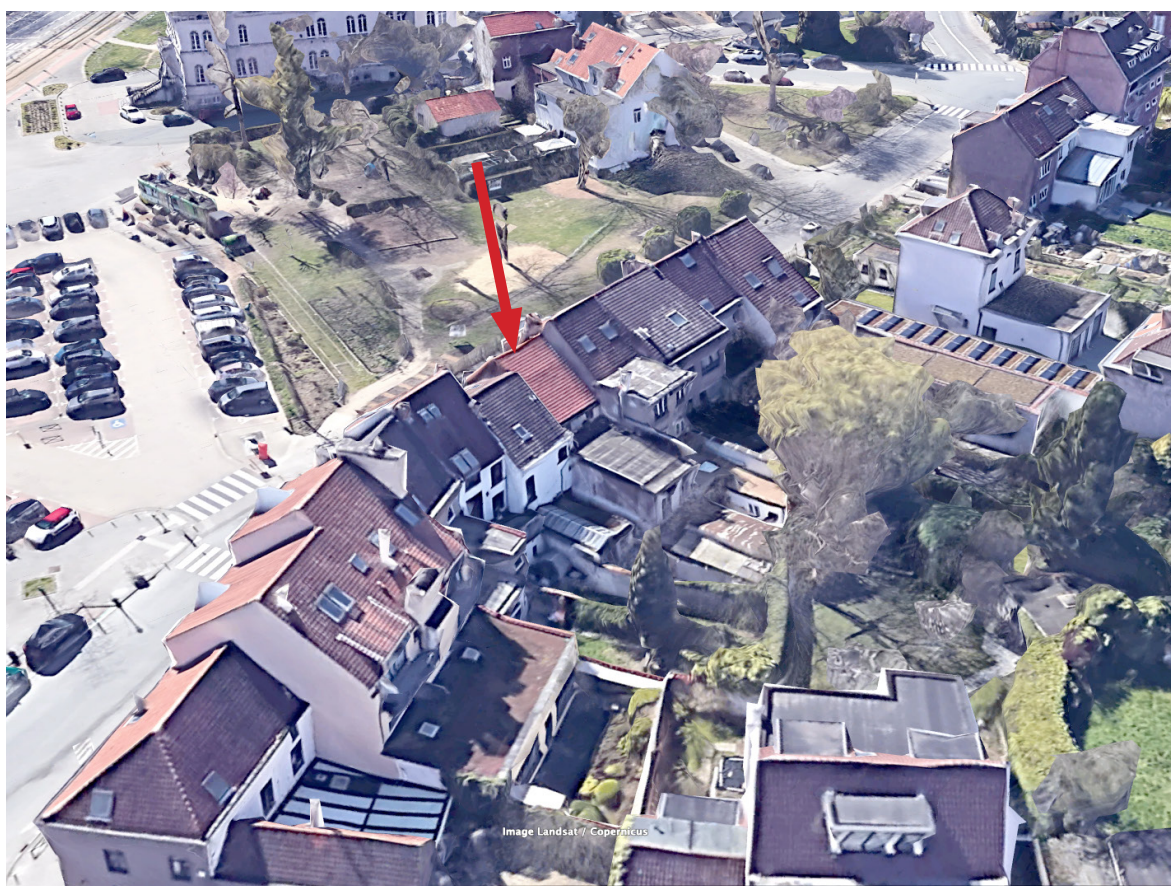
Vue aérienne façade arrière