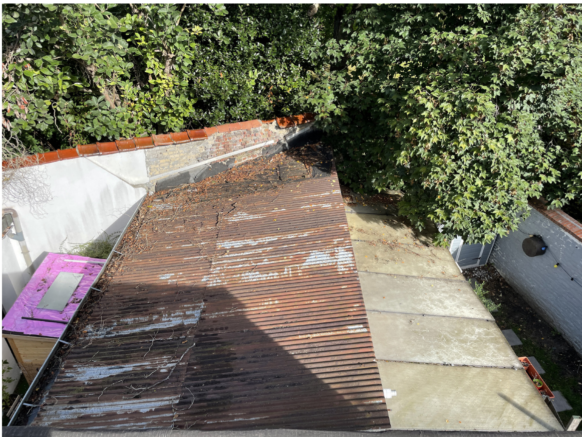
Vue 03 - Toitures arrières