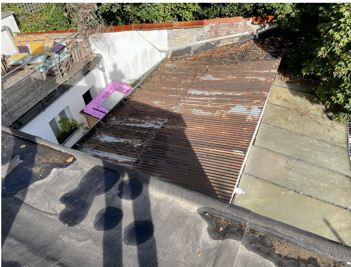
Vue 05 - Voisin gauche n°26 fond de jardin