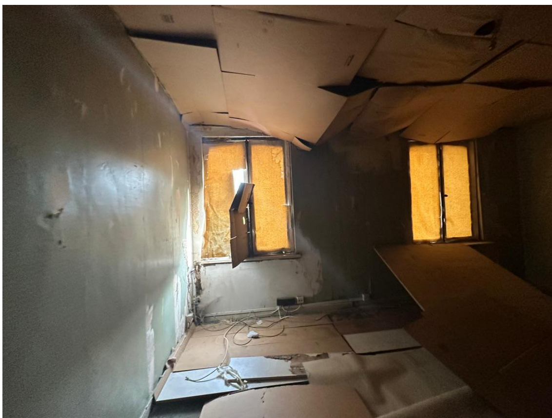
Vue 03 - Logement façade avant premier étage