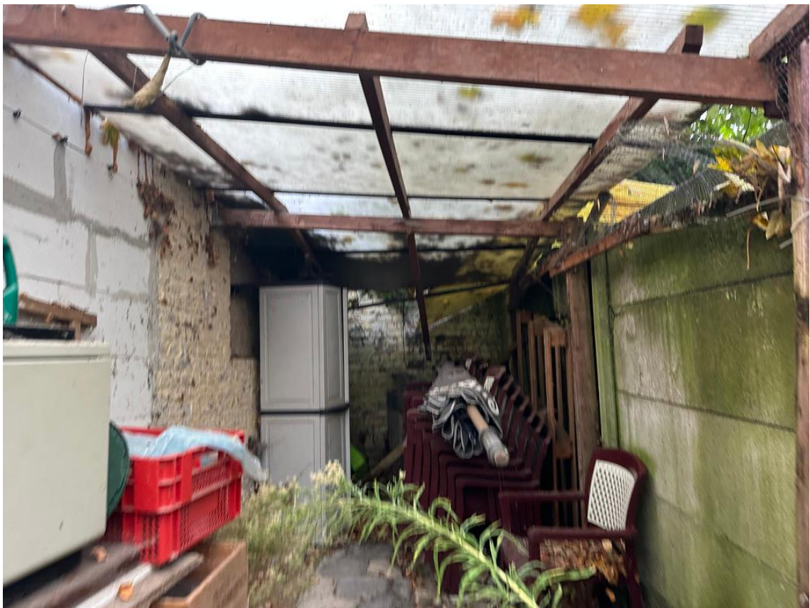
Vue 06 - Annexe en façade arrière