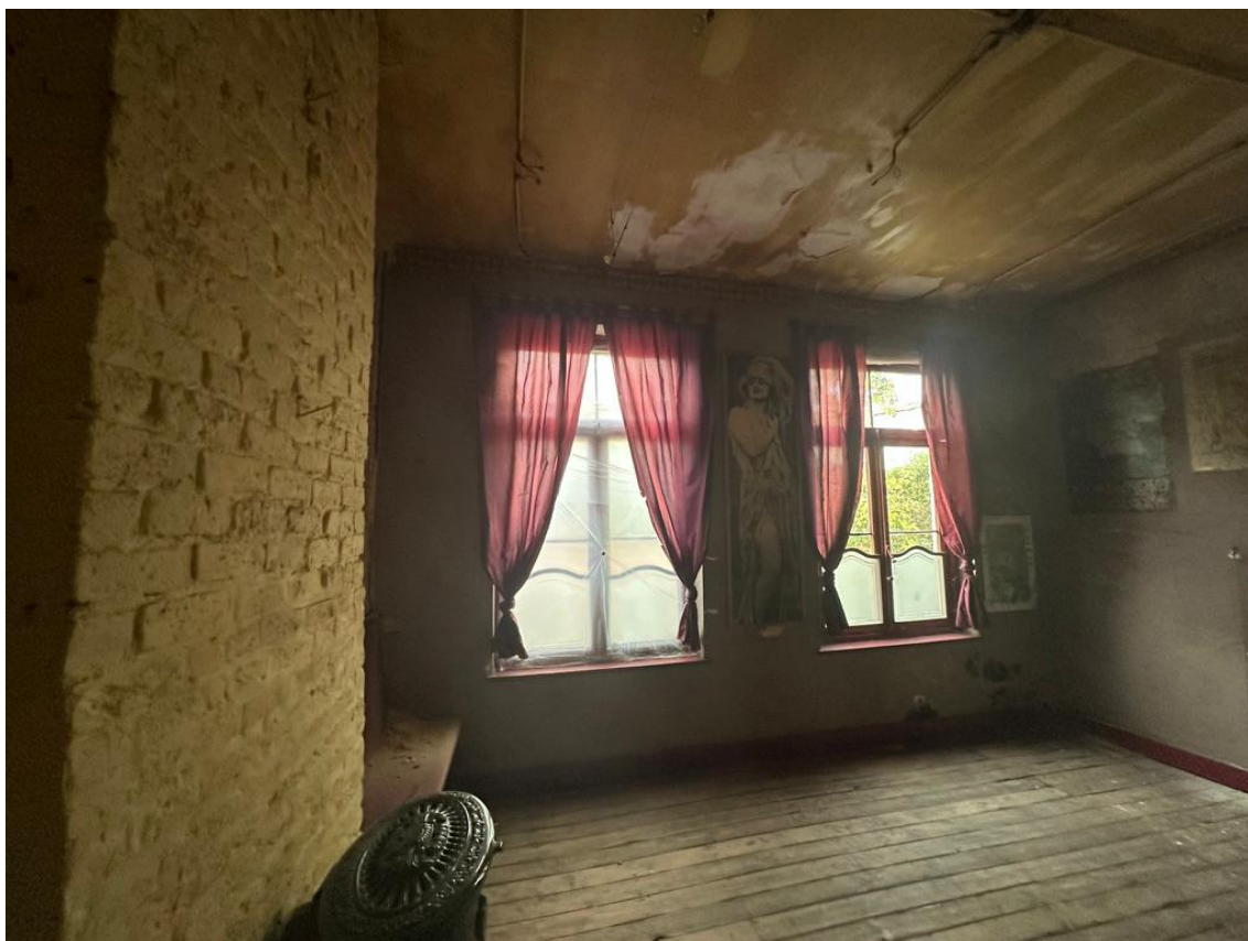
Vue 03 - Salle en façade arrière restaurant