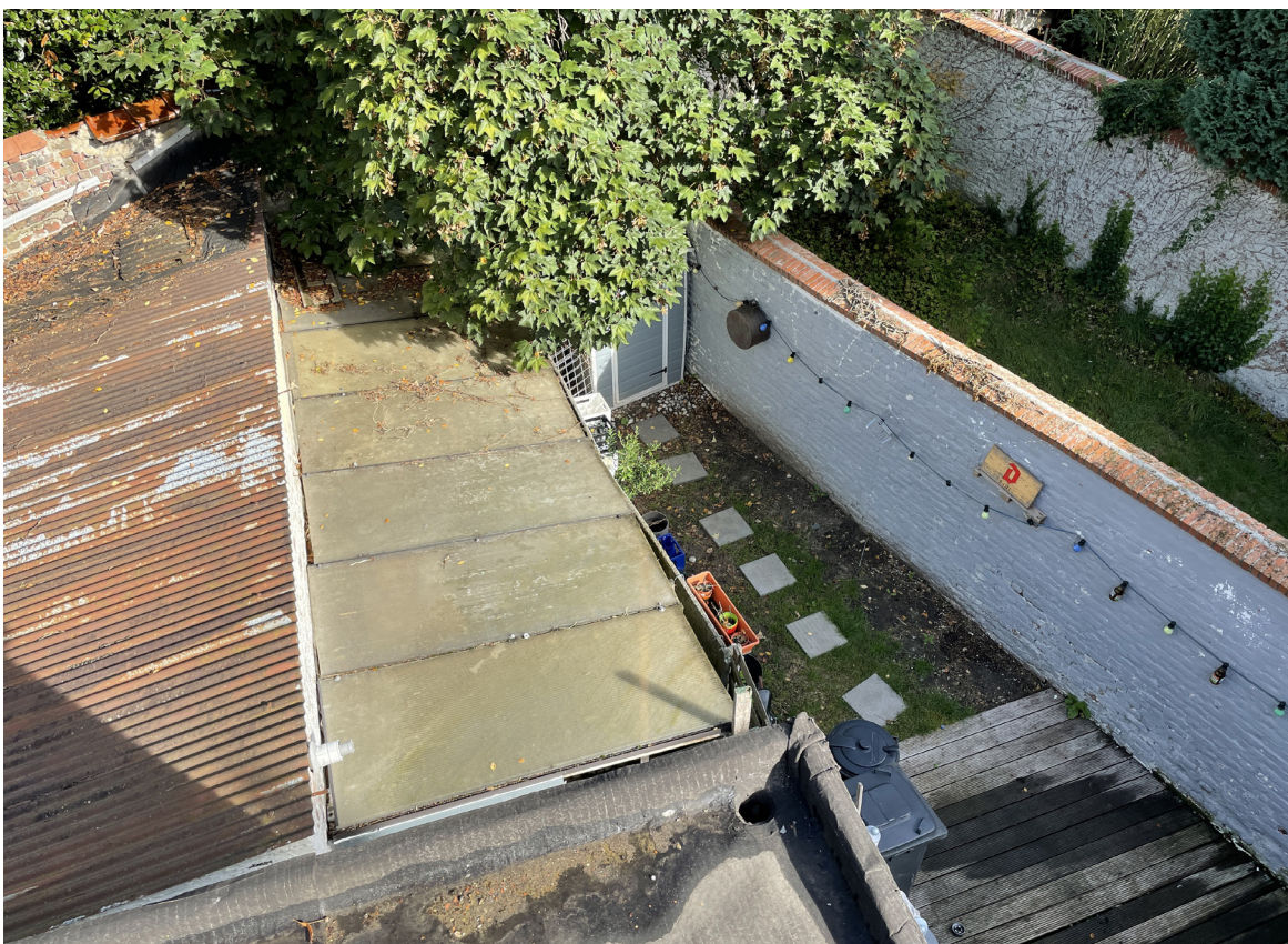
Vue 04 - Voisin n°4