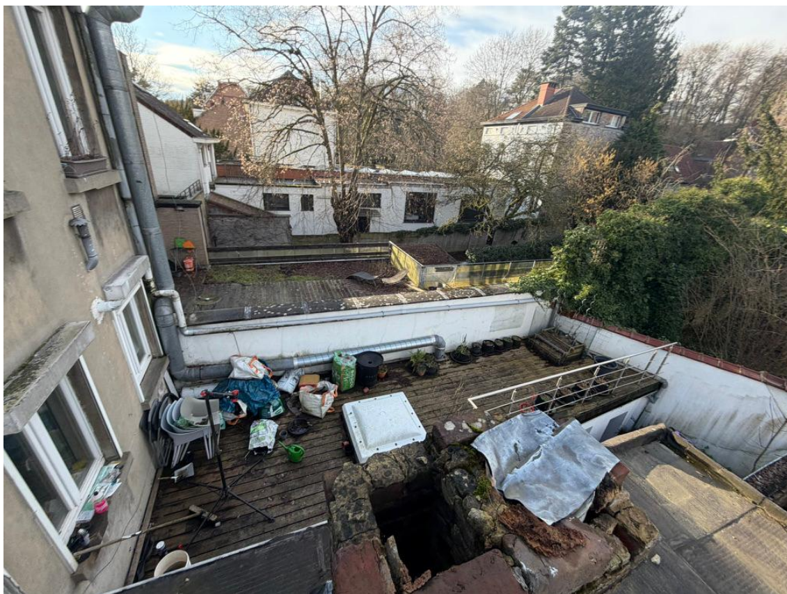
Vue 06 - Voisin gauche n°26 annexe arrière