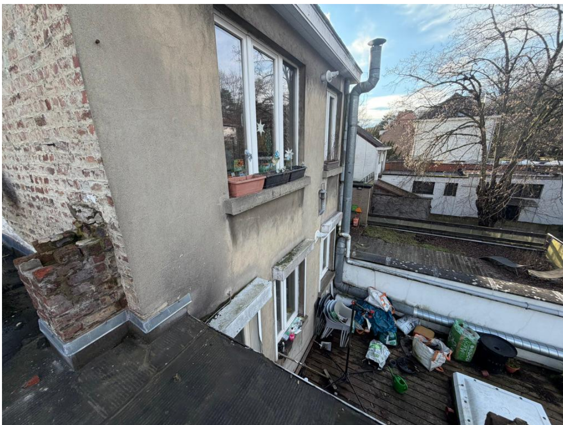
Vue 07 - Voisin gauche n°26 façade arrière